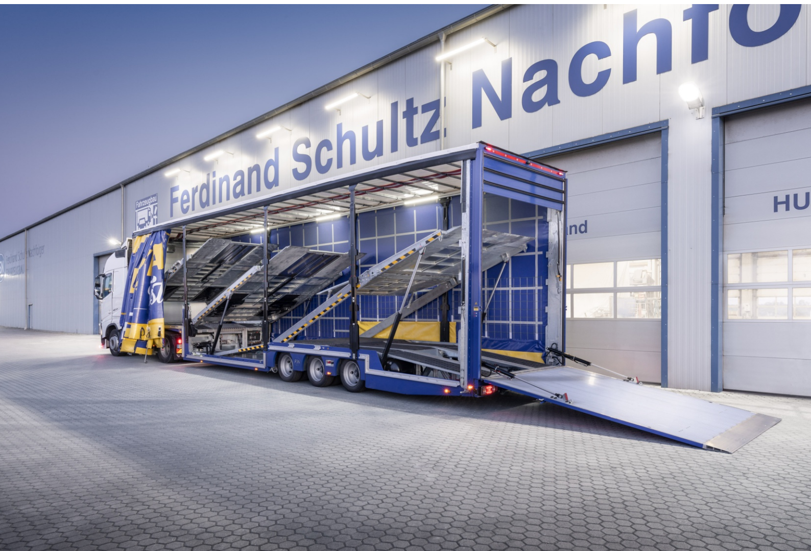
Sattelaufleger mit Schiebep lane SA-CS-FT-32